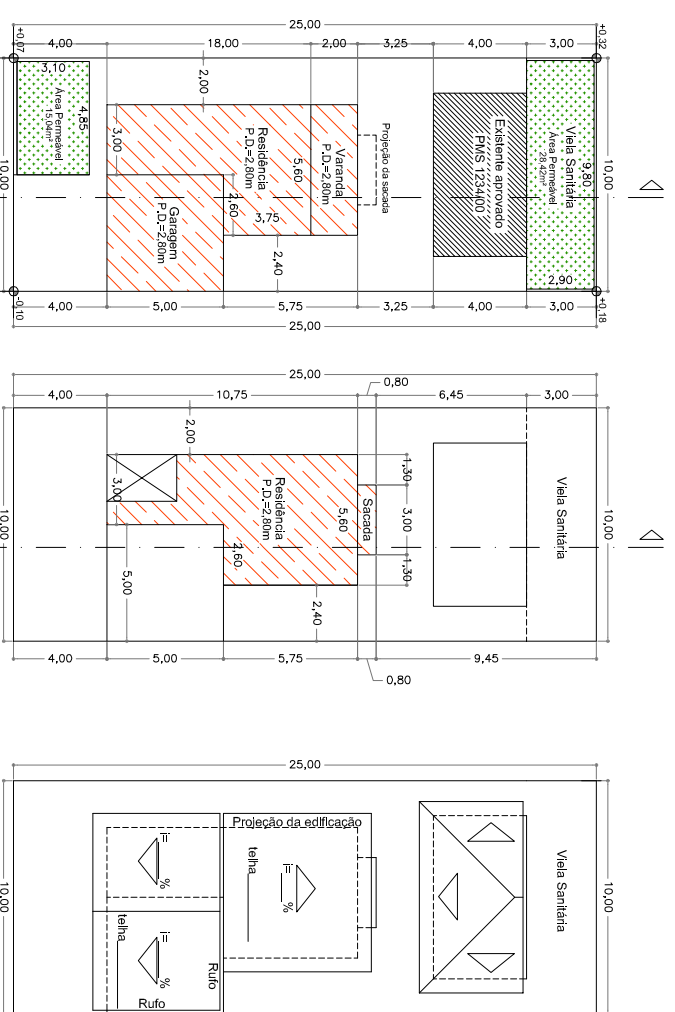
IMPLANTAÇÃO - PAV. TÉRREO ESCALA 1:200